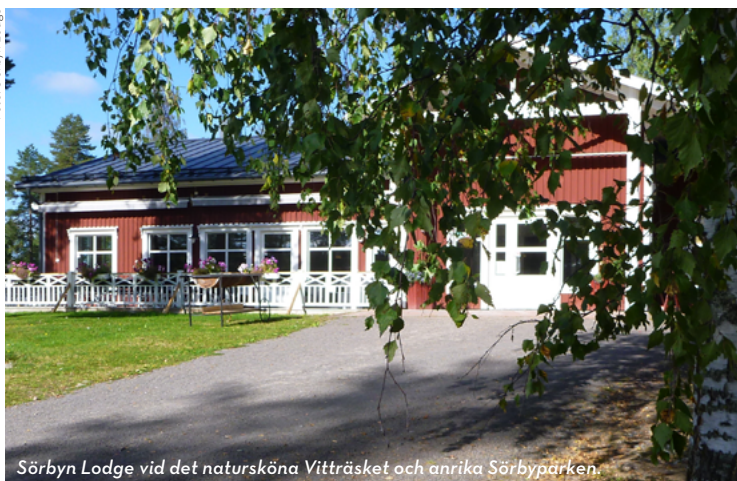
Sörbyn Lodge vid det natursköna Vitträsket och anrika Sörbyparken.

När du passerat Niemisel längs väg 760 kommer du till Lassbyn, Sörbyn och Gunnarsbyn. Ett kluster av byar som mer eller mindre hänger ihop. I området finns flera utflyktsmål och sevärdheter. Här kan du bo i hyrda stugor, öppna stugor, hotell och på ställplatser.