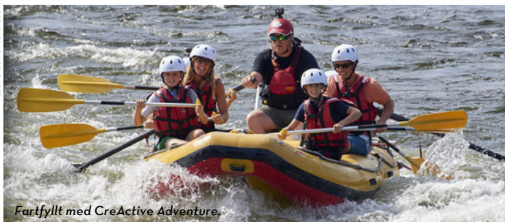
Fartfylld med CreActive Adventure.

Norr om Gunnarsbyn ligger Överstbyn, sedan fortsätter vägen mot Valvträsk och Mårdsel. Landskapet förändras efter din resa uppströms Råneälven. När du passerar Valvträsk ändrar det karaktär, från jordbruk och gårdar till mer skog. Du närmar dig Polcirkeln.