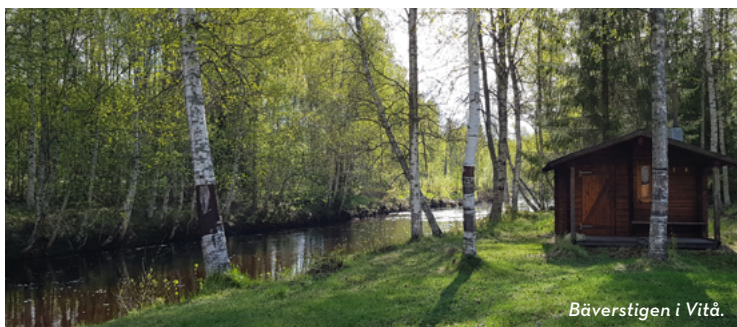
Bäverstigen i Vitå.