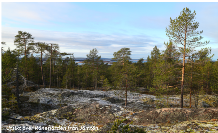
Utsikt över Rånefjärden från Jämtön.