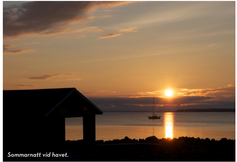
Sommarnatt vid havet.