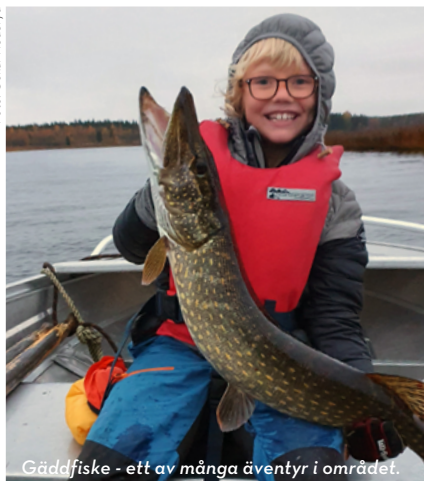
Gäddfiske - ett av många äventyr i området.

Längs väg 760 från Råneå på den norra sidan av älven ligger byarna som ett vackert pärlband efter varandra och mellan byarna breder odlingsmarker, ängar och beteshagar ut sig med älvens porlande i bakgrunden. Här finns flera bra utflyktsmål att stanna till vid med fina fiskeplatser och flera öppna stugor för övernattnin. Längs den södra sidan av älven ligger mysiga platser som Snöberget och Pålberget.