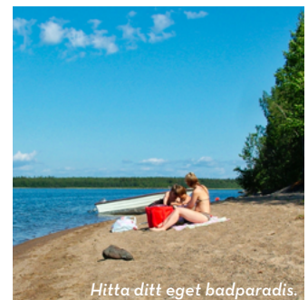
Hitta ditt eget badparadis.