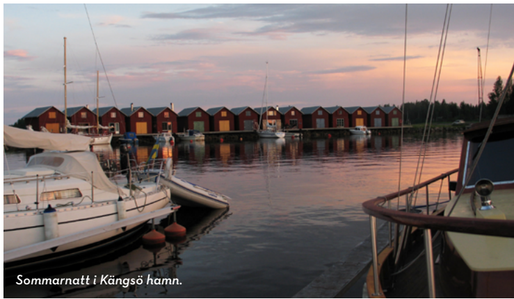
Sommarnatt i Kängsö hamn.