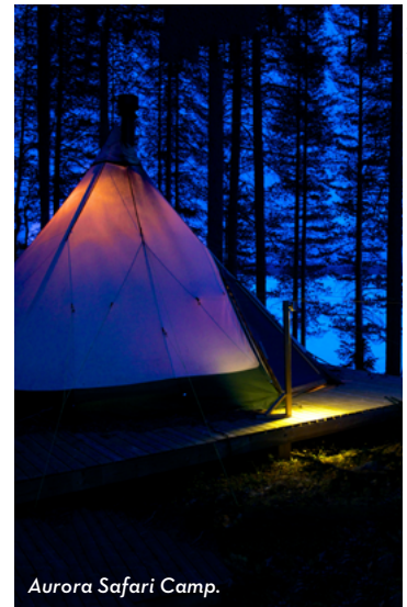
Aurora Safari Camp.