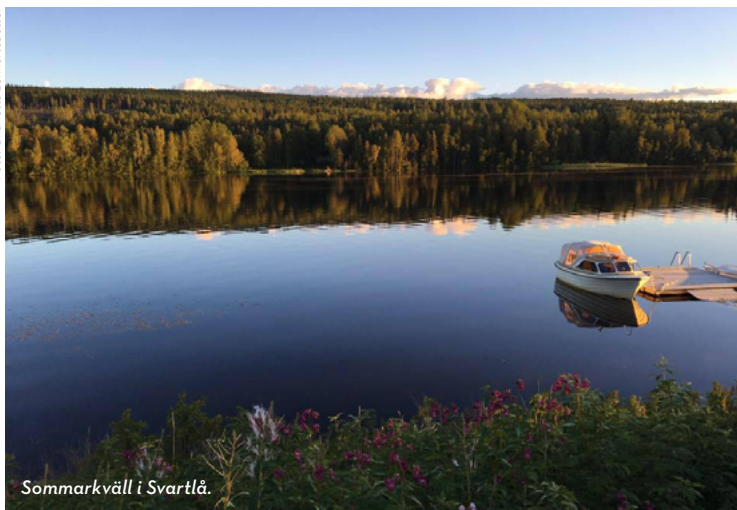
Sommarkväll i Svartlå.

Berget med milsvid utsikt nära Svartlå. Även en ekopark och en av inlandets mest populära vintersportanläggningar i samma område bär namnet Storklinten. Området har mångskiftande natur och rika möjligheter till friluftsliv och strövområden.