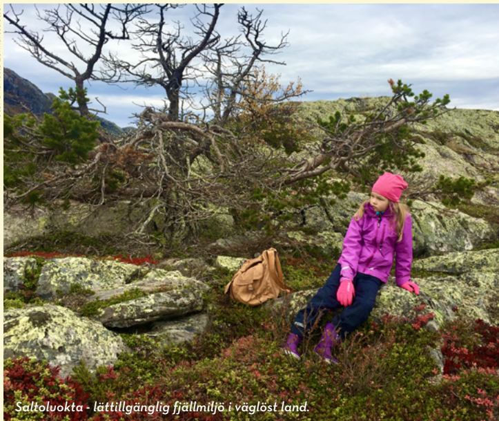
Saltolukka - lättillgänglig fjällmiljö i väglöst land.

Lule älvadal är perfekt för utomhusaktiviteter som vandrings-, fiske- och paddelturer. Tänk på att rätt utrustning gör turen trevligare. Ta med karta och kompass, myggmedel, mat så att du klarar dig, kläder efter väder, vattenflaska och kåsa. På nätet kan du hitta tips på utrustningslistor om du är osäker och tänk på att packa lätt. Det finns vandringsturer från ett par timmar till ett par veckor så läs på ordentligt innan du ger dig iväg.