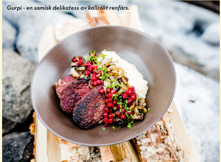
Gurpi - en samisk delikatess av kallrökt renfärs.

Titta efter de lokala rätterna på restaurangernas menyer. Samla på smakminnen. Den bästa souvenirn går att äta. Salt, sött eller syrligt, du väljer själv. Även i de lokala matbutikerna kan du hitta närproducerade godsaker. Köp med dig något gott. Behåll smaken av Lule älvdal.