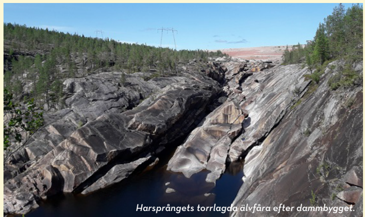
Harsprångets torrlagda älvfåra efter dammbygget.

Här uppförde Vattenfall ytterligare ett provisoriskt samhälle för cirka 3 000 personer i samband med bygget av dammen och kraftverket i Messaure. Idag återstår bara en orienteringstavla där det livliga torget en gång låg. Den imponerande kraftverksdammen kom att bli Vattenfalls största dammbygge. Fyllnadsmaterialet motsvarar fyra Cheopspyramider. Se gärna filmen "Minnet av Messaure" på Youtube innan ditt besök. I Messaure finns ett av Vattenfalls värnområden för biologisk mångfald. Området är en av landets rikaste växtplatser för bombmurkla och flera rödlistade arter av svampar, lavar och kärlväxter. Här finns också flera rödlistade skalbaggsarter. Området ingår i EU:s nätverk för värdefull natur - Natura 2000.