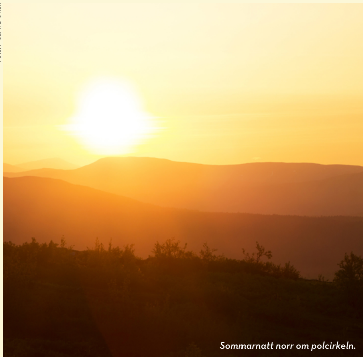
Sommarnatt norr om polcirkeln.

Norra polcirkeln, även kallad den arktiska cirkeln, är den yttersta plats räknat från Nordpolen där solen inte går ner vid sommarsolståndet, och inte går upp vid vintersolståndet. När du kommer efter vägen längs Luleälven, väg 97, passerar du polcirkeln mellan Vuollerim och Jokkmokk. Här finner du en portal och en enklare rastplats.