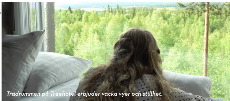
Trädrummen på Treehotel erbjuder vackra vyer och stillhet.

Harads är ett trivsamt litet samhälle som ligger högt upp på många världsresenärers bucketlists. De stora besöksmålen kompletteras med det lilla samhällets charm. Här finns också en stark kulturådra. Edeborg i Harads är Haradsrevyns hemmascen och i Edefors finns en av länets vackraste utscener med älven som kuliss, bland annat på Sommarljusvisfestival.