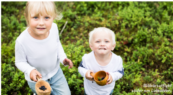
Blåbärsutflykt söder om Luleälven.

Väg 616, även kallad Rutt 616, tar dig uppströms älven genom byarna Gäddvik, Bälinge, Avan och Unbyn. Byarna vid Luleälvens bördiga strand länkas ihop via jordbruket. Efter vägen finner du flera av våra kustnära matproducenter och gårdsbutiker. Med älven på din högra hand och bergen och skogarna på din vänstra bjuder landskapet in till många härliga naturupplevelser.