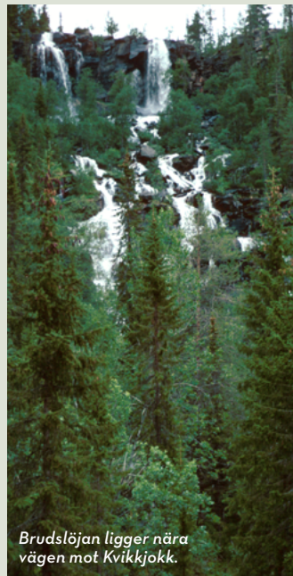
Brudslöjan ligger nära vägen mot Kvikkjokk.

För dig som vill "prova på" fjällen eller helt enkelt inte har tid att göra en längre fjällvandring finns fina dagsturer till Prinskullen, Snjerak, Nammatj eller Kaskaivo. Lokala guider erbjuder båtturer i det slingrande Kvikkjokksdeltat.