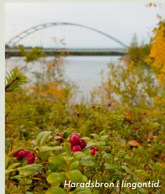
Haradsbron i lingontid.

Naturskönt kulturområde där du själv kan ströva fritt. Ta med kaffekorg och njut av miljön, se historiska byggnader, stenlabyrinten mm.