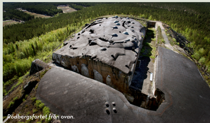
Rödbergsfortet från ovan.

En del av Bodens Fästning, Rödbergsfortet fungerade som "låset i norr" under två världskrig. Guidade visningar. Förbokas på annan säsong än sommaren.