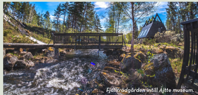
Fjällträdgården intill Ájtte museum.

Det finns 6 olika vandringsleder med olika längd intill Jokkmokks samhälle. På Infocenter kan du hämta foldern "Vandringsleder i Jokkmokk" med mer information.