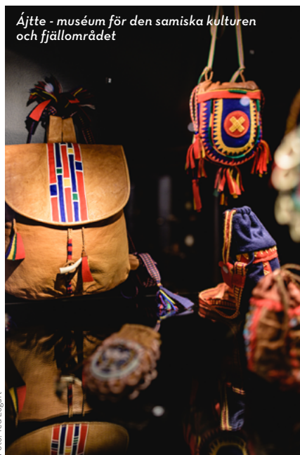
Ájtte - muséum för den samiska kulturen och fjällområdet