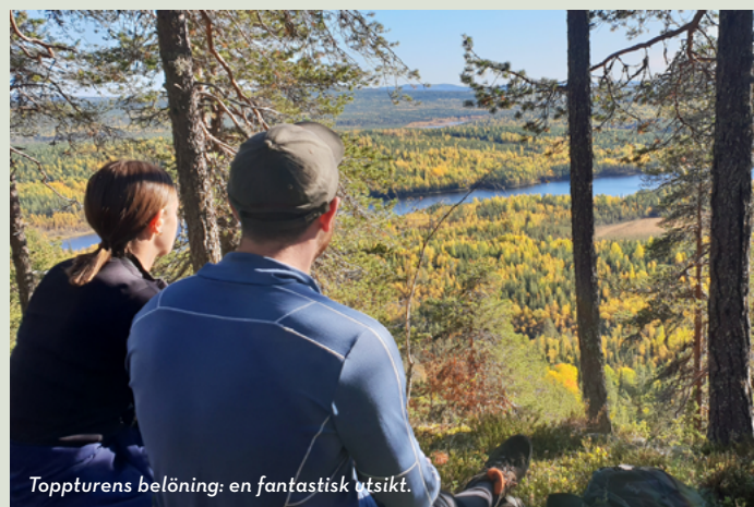
Toppturens belöning: en fantastisk utsikt.